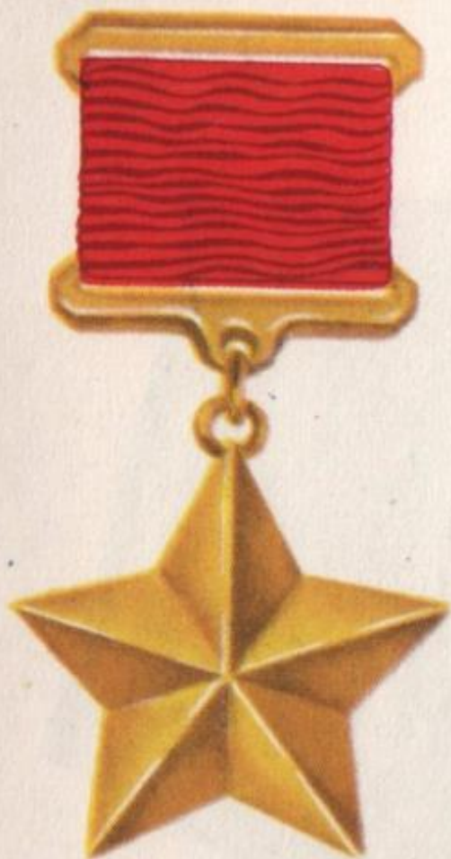
Медаль „Золотая Звезда“

Медаль «Золотая Звезда» является знаком отличия для лиц, удостоенных высшей степени отличия СССР – звания Героя Советского Союза. Медаль изготовлена из золота и имеет форму пятиконечной звезды. На оборотной стороне медали надпись «Герой СССР» и номер медали.