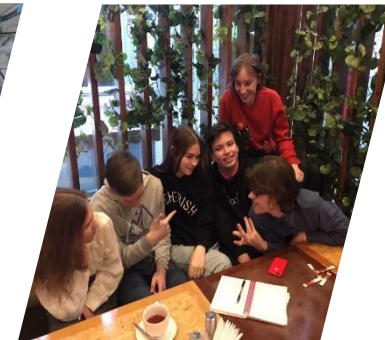
Tet-a-tet, Зеленогорск, 2019 г.