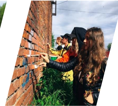
Цветущий город Качканар, 2019 г.