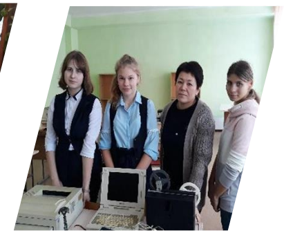
Музей XX века Междуреченск, 2019 г.