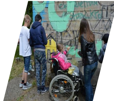
Рисуют все! Нижний Тагил, 2019 г.