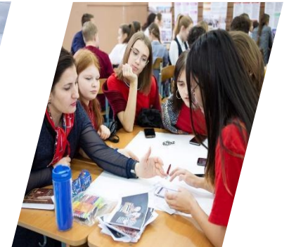
Art-chill, Глазов, 2019 г.