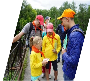
Мосты Тагила, Нижний Тагил, 2019 г.